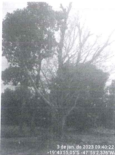
Figura 1 – Figueira morta.