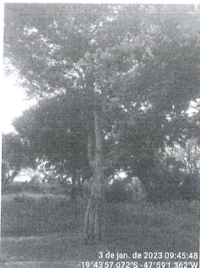
Figura 2 – Sibipiruna comprometida.